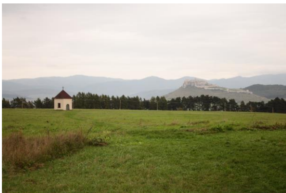
obr. 2- Kaplnka sv. Rozálie