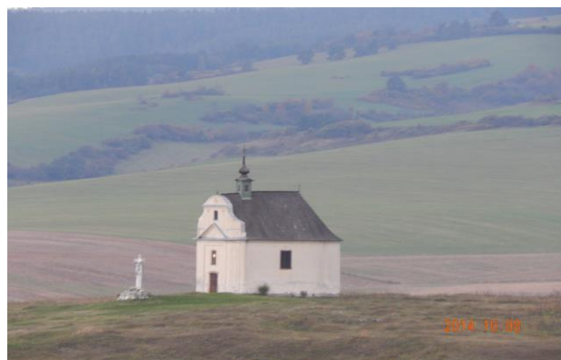
obr. 3 –Kaplnka sv. Kríža