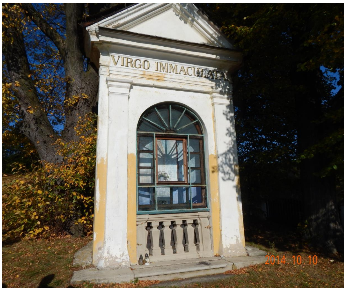
obr. 4- Kaplnka Spišský Štiavnik [foto Feriancová, 2014]